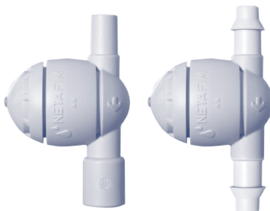
Válvula A.D. (Antidrenante) conectores a presión (macho/hembra)